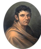
Città di Francesco Lomonaco